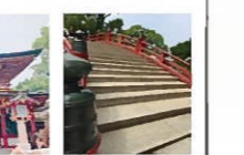
..... 門司港レトロ地区 .....