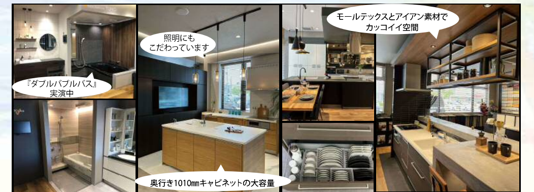
「ダブルバブルバス」実演中

住所:金沢市大友1丁目131 TEL:076-295-9889 定休日:火曜・水曜 ぜひショールームをご覧ください。