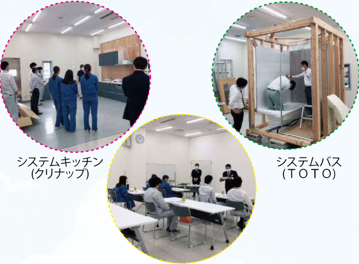
システムキッチン (クリナップ)

3年ぶりにメーカーさんの協力を得て弊社1階研修室にて「ビギナーズスクール」を開催することが出来ました。「システムバス」と「システムキッチン」の施工を体験する事で、日々の業務の知識に少しでもプラスになれば幸いです。参加して下さった皆様ありがとうございました!! 来年も開催したいと思います!!是非ご参加ください!