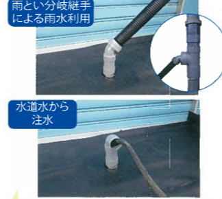
様々な水源を活用可能