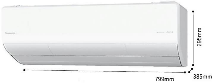
799mm 295mm 385mm