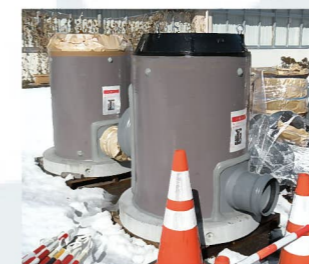
【マンホールトイレ】