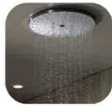
オーバーヘッドシャワー

今回の研修で、実際に体験したことを営業で活かし、お客様に勧めていきたいと思っております!!