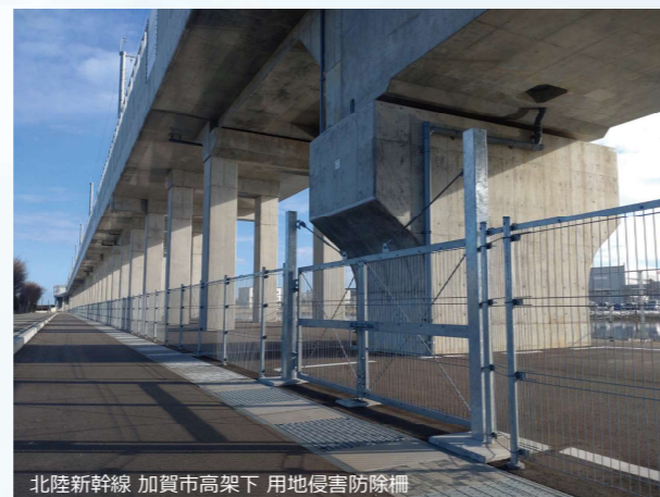
北陸新幹線 加賀市高架下 用地侵害防除柵