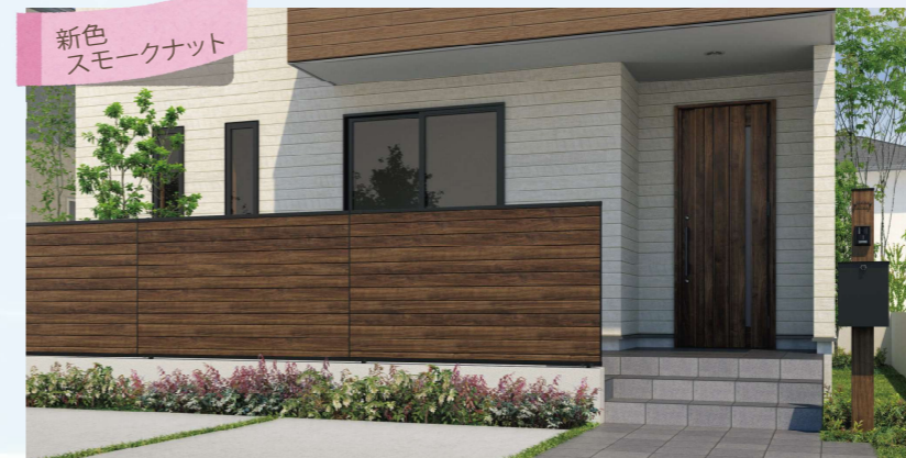
新色 スモークナット

大人気のシャトレナシリーズがリニューアル！木調が映えるハイデザインで、コスパも◎！