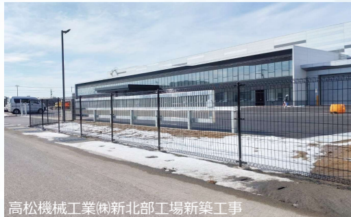
高松機械工業(株)新北部工場新築工事 外周部にFMフェンス【朝日スチール工業】大型引戸【ハシモト式門扉】、カーポート【三協アルミ】などを施工しました。