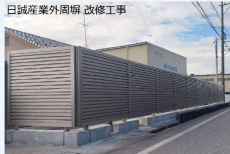
日誠産業外周塀 改修工事