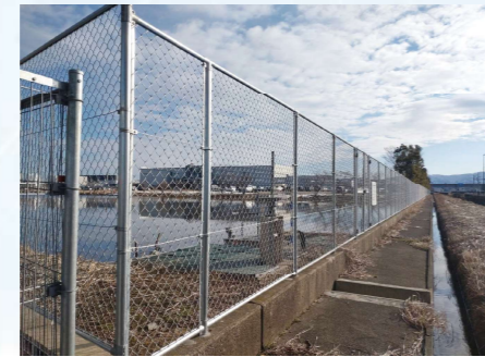
金沢村田製作所美工場 外周セキュリティ更新工事