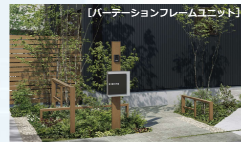
【パーティションフレームユニット】

プライベートとパブリックを程よく区切るパーティションフレームユニット。ランダムに配置されたフレーム構成が、ファサードにリズムをつけます♪