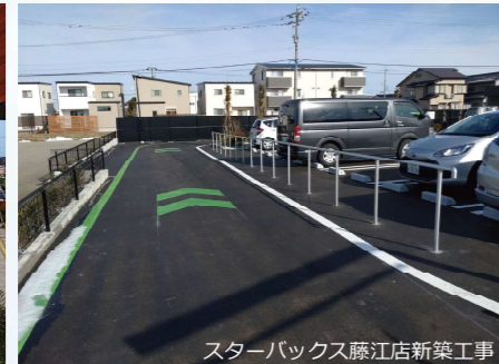
スターバックス藤江店新築工事