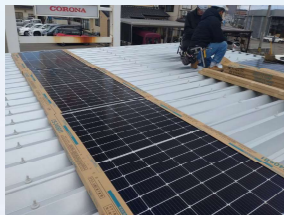
金具の上に太陽光パネルを設置していきます！