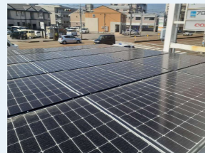
きれいに並べていきます。