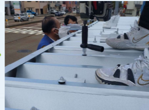
折板屋根に専用の金具を取り付けて行きます。