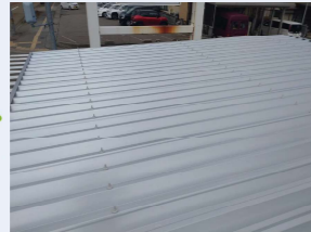
まだ太陽光を載せてないカーポート