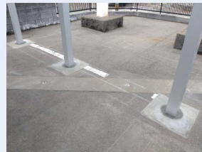
確認申請の元で基礎工事からしっかりと行います！

皆様に現物を見ていただけるよう、弊社グループ会社の金沢商行駐車場に実機の展示を設置致しました！